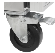
Kraftiga hjul som tillval