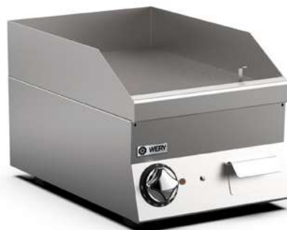
Bilden visar modell FTE64EL