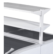
Reklamhyllor som tillbehör